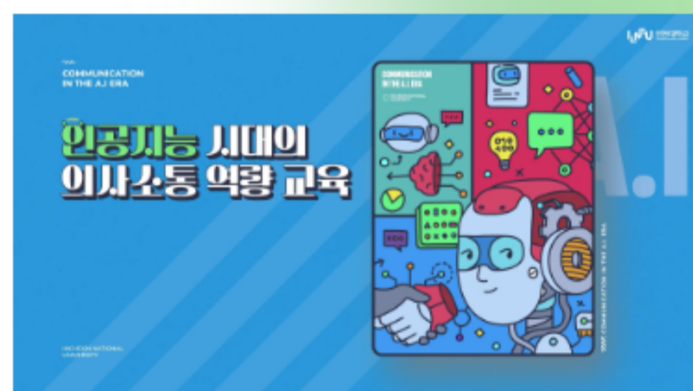
인공지능 시대의 의사소통 역량 교육