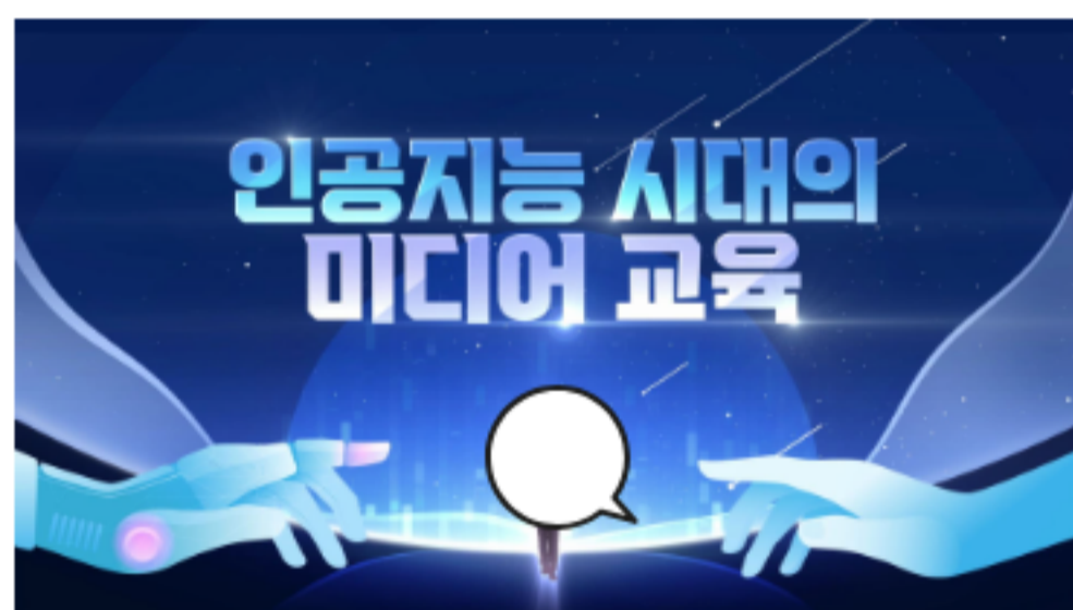
인공지능 시대의 미디어 교육